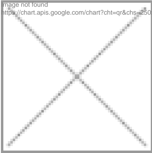
image not found https://chart.apis.google.com/chart?cht=qr&chs=250x250&chld=H|0&chl=https%3A%2F%2Fproventus-commercial.de%2Fproperty%2Fprovisionsfrei-grosszuegige-

https://proventus-commercial.de/property/provisionsfrei-