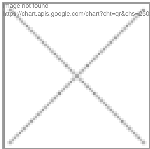
Image not found https://chart.apis.google.com/chart?cht=qr&chs=250x250&chld=H|0&chl=https%3A%2F%2Fproventus-commercial.de%2Fproperty%2Fberlin-heinersdorf-einzelhan...